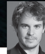
Leitung Andreas Felber